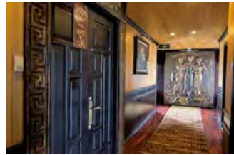
▲分厚い木材を用いた重厚な扉

磨きこまれた黒光りする床、漆のような仕上がりの家具、ヴィクトリア調の小物。船自体は新しいが、レトロな風情を存分に味わえる内装になっている。