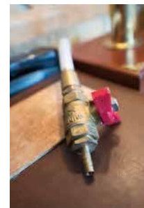
▲ペリカン号の酸素ポンペは、1時間以上もつという

いくら安全に気を配っても、何が起るかわからないのが海上。安全対策に力を入れている船が増えている。ペリカン号ではハロン湾で初めて、乗客人数分の酸素ポンペを各室に備えた。