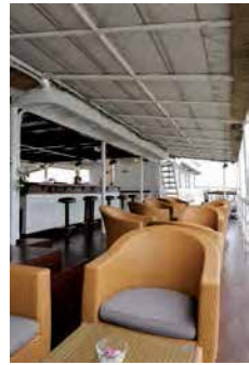
▲デッキには日陰が多く、日焼けが気になる人には嬉しい

窓や扉が「キャビン」を強調するデザインとなっていて旅情満点。ハノイで人気のフランス料理店「プレスクラブ/Press Club」の系列で、味に定評がある。ビュッフェ形式のため、言葉に不安のある人でも心配ない。