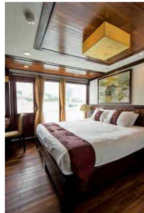
▲カテゴリーによっては、ガラス戸の向こうの光景を寝ながらにして楽しめるキャビンも ◀レストランには、くつろげるソファスペースがある

太鼓の音が鳴り響けば、船旅の始まりだ。船内はベトナムの伝統的なテイストを随所にあしらった重厚な雰囲気。アクティビティを楽しむほか、客室の窓から望む絶景を眺めながら、ゆっくりと時間を過ごすのもいい。