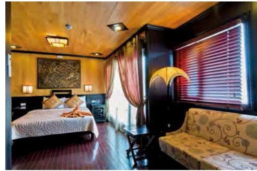
▲板張りの天井が、いにしへのジャンク船を思い起こさせる