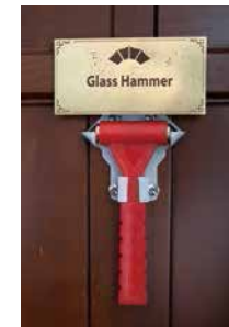
▲いざという時に窓を叩き割るハンマー。写真はアウコー号のもの