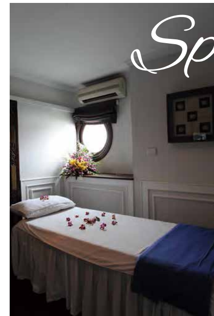
▼ヴィクトリースター号のスパは3床あるが、3人一緒に施術を受けたい場合は乗船前に要予約