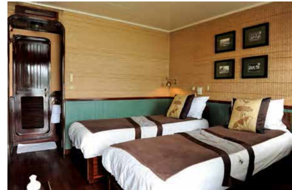
▲暖かみのある茶系でまとめた内装