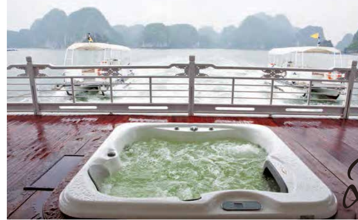
◀甲板上に据え付けられたアウコー号のジャクジー

フレンドリーなもてなしが身上のアウトホームな船。ベトナムの伝統家具や盆栽といった、東洋趣味をインテリアに取り入れているのがユニーク。年内には、プール付きの新造船が完成を予定している。