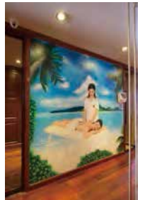
▲ゴールデンクルーズ号のスパはとってもカラフル