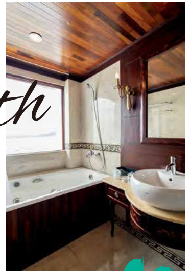
◀ヴァイオレット号の鳳凰キャビンの風呂はジャクジー付き