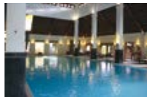
日焼けが気になる人は屋内プールでのんびり