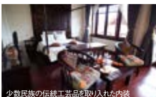
少数民族の伝統工芸品を取り入れた内装

1 Xa Linh Village, Mai Chau Dist., Hoa Binh Province