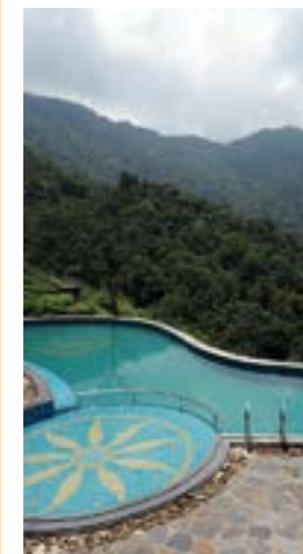
山中に浮かぶように造られたプール。これぞ山のリゾートの醍醐味だ

仏領時代の避暑地タムダオの山頂近くに建つ、夏でも涼しいリゾート。設備が少々古くサービスも素朴だが、温かみがあるのんびり過ごせる。特筆すべきは、山並みを堪能しながら泳げるプール。レストランでは、タムダオの特産野菜スースーを使ったメニューが10種類以上も用意されている。