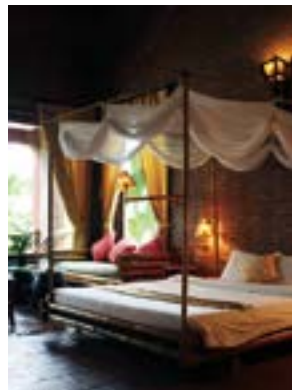
2名1室利用で1泊203万3000VND(約9770円)のデラックスオーシャンビューヴィラ

1 Quang Cu Commune, Sam Son Dist., Thanh Hoa Province 2 (037) 379 3333 www.vanchai-vn.com ハノイ市街地から国道1号線を南下。タインホアで47号線に入ってサムソンビーチへ