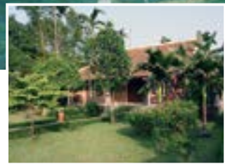
ヴィラとヴィラの間隔が広く、プライベート感がある

グラススキークラブ / Grass Ski Club 1 Mieu Village, Tien Xuan Commune, Thach That Dist., Hanoi 2 (04) 3982 0431 7:00 ~ 19:00 0.5万 VND (約240円) ~