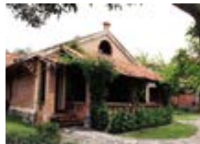
建造物は全てレンガ製