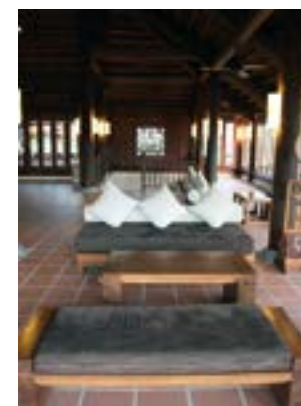
木の柱が並ぶロビーは、涼しい風が吹き抜ける