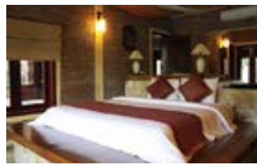
2名1室利用で1泊550万 VND (約2万6440円) のスイートヴィラ

2011年に一部がオープンしていたが、2013年にプールが完成(2013年6月5日現在、一部工事中)。日本のスーパー銭湯並みに種類豊富なプールが揃い、家族で楽しめる。予約すれば、敷地内にあるワニの水槽での餌やりも可能。