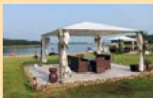
湖を海に見立てた敷地内の「ビーチエリア」。東屋やバーなどがビーチムードを演出。ボート遊びもOK

ハヤトリ「スースー / Su Su」の茎を使った「スースーのサラダ / Nom Ngon Su Su voi Ruoc」13 万 9000VND (約 670 円) ++