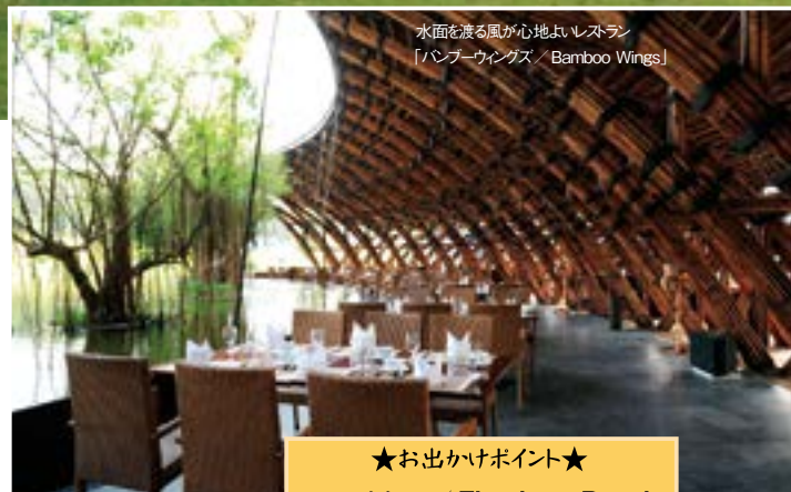
水面を渡る風が心地よいレストラン 「バンブーウィングス / Bamboo Wings」

ゴルフ場のような広々とした緑の丘陵に、ログハウス風ヴィラが点在するこのリゾートは、2012年にオープンしたばかり。竹をふんだんに使った水辺のレストランは丘に隠れるような造りで、自然を大切にしているリゾートの心意気が伝わってくる。