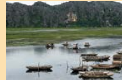
とがった岩山がそびえる湿地を、竹舟に乗って遊覧できる。ホテルから歩いてすぐの場所に乗り場がある