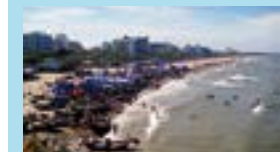
海岸沿いにシーフード店がずらりと並び、海岸になぜかシマウマ状にペイントされた馬が闊歩する不思議ビーチ

北部最大のビーチ、タインホア(Thanh Hoa)省サムソンビーチのはずれに建つ海辺のリゾート。庶民的なエリアから離れているため静かに過ごせる。緑溢れる庭園に散らばるヴィラでの滞在がおすすめ。