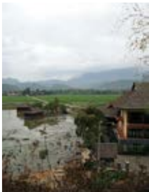
周囲は田んぼやため池に囲まれ、自然がいっぱい

1 Mai Chau Village, Mai Chau Dist., Hoa Binh Province 2 (0218) 386 8959 www.maichaulodge.com ハノイ中心部から国道6号線を西へ約135km