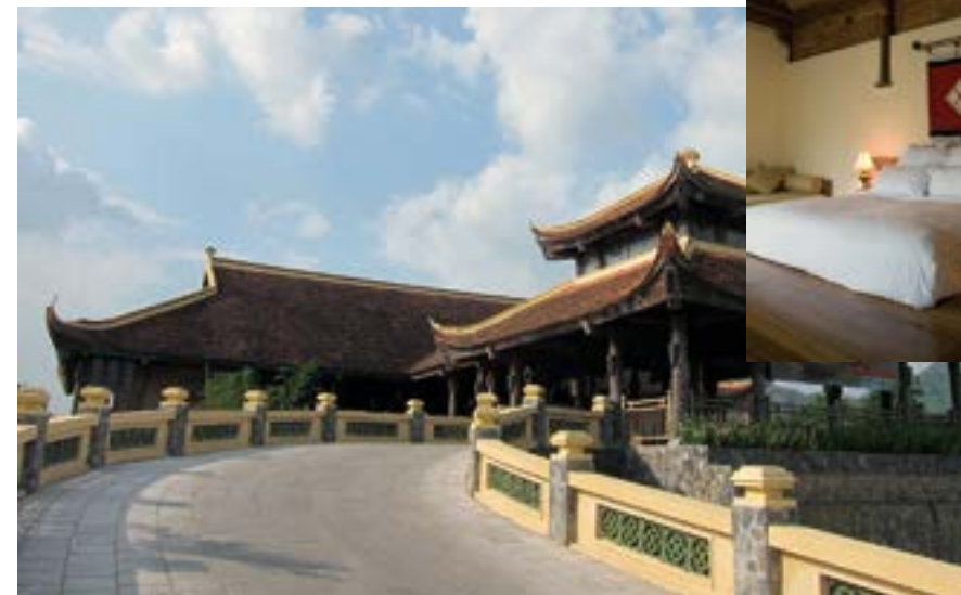
(右上) 2名1室利用で1泊 350 万 VND (約1万 6830 円) へのスーペリアヴィラ (上) フェエ王宮をイメージしたレセプション棟