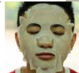
週に2~3日は、パックで肌に栄養注入。寝る前のリラックス時間なんだ

ニキビがないツルツル肌を目指して、寝る前にパックをしたり、たまにスパにも行くんだ。美しさが女性だけのものとは思わない。ファッションスナップに参加するときは、ファンデーションを塗ることだってあるよ。理解できない人も多いだろうけれど、自分が必要だと感じればアリだと思うな。