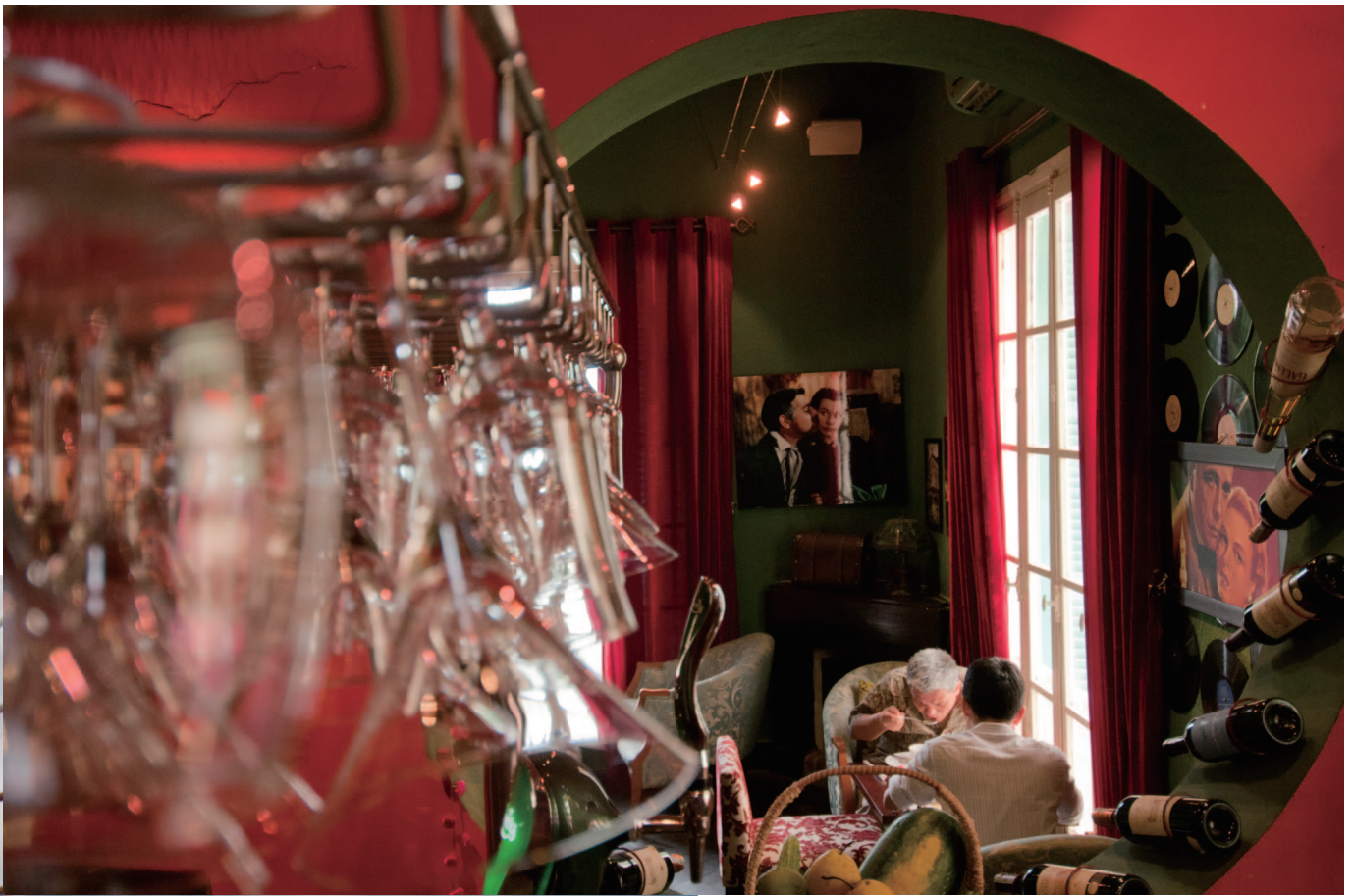
(左) ハロン (Ha Long) 湾に架かるバイチャイ (Bai Chay) 橋 (上) ハノイのカフェバー「バーベッタ / Bar Betta」